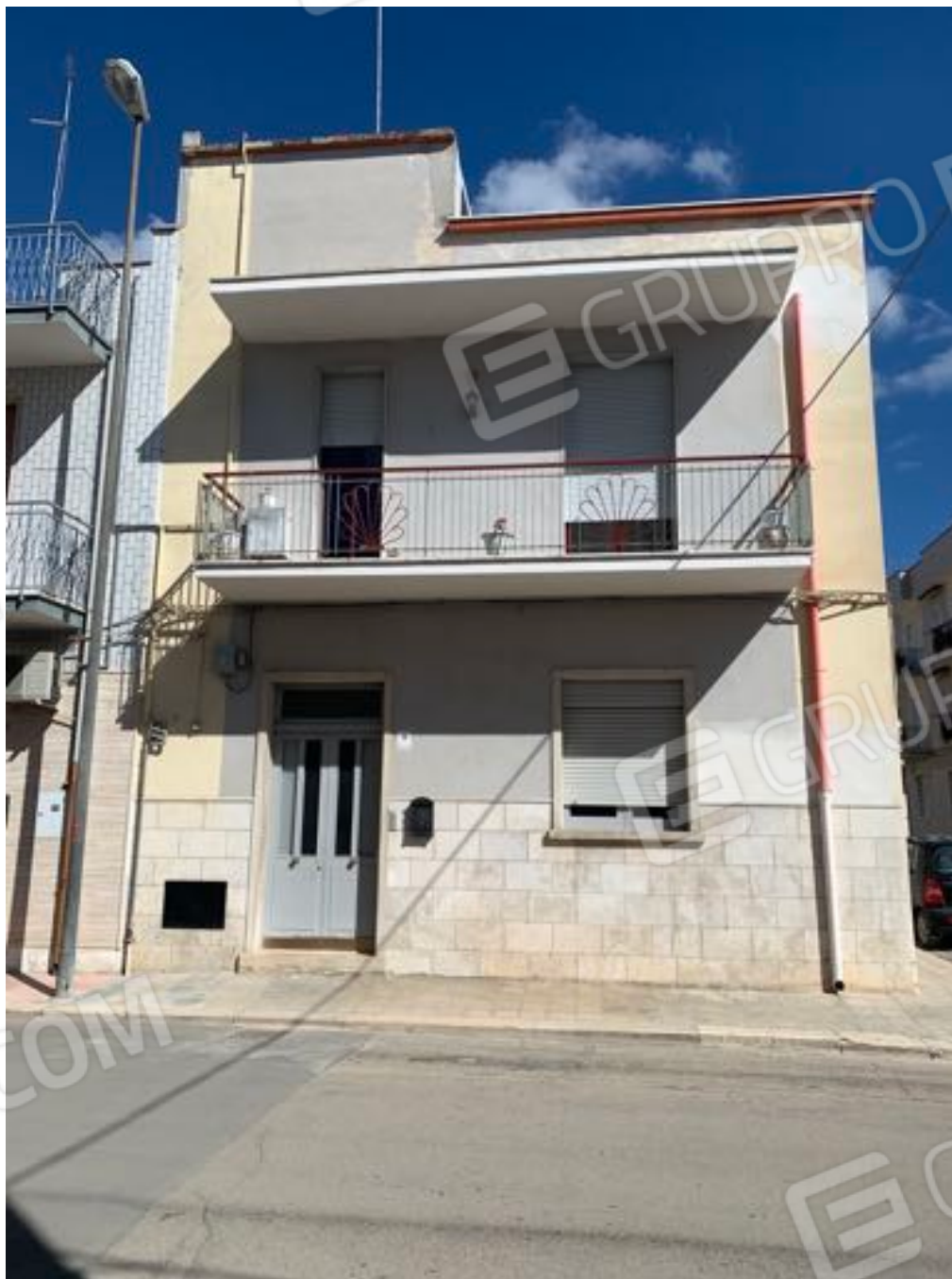
Vista n. 1 Esterna all'immobile con accesso da via Claudio Galeno n. 29.