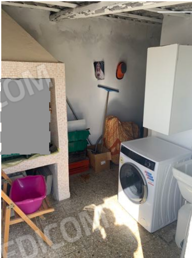
Vista n. 21 Lastrico solare - Ripostiglio