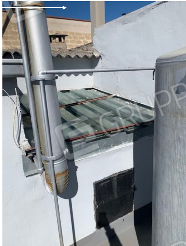
Vista n. 22 Lastrico solare - Cavedio.

1) Si precisa che da Progetto Approvato in Comune risulta un cavedio in prossimità dei due ambienti.