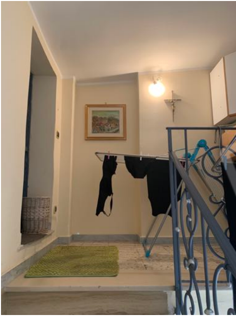
Vista n. 19 Lastrico solare - Pianerottolo