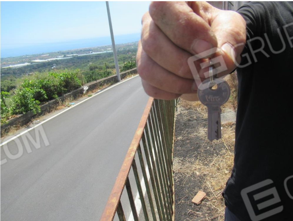
Foto n ° 24 – Consegna delle chiavi al C.T.U. da parte del fabbro. –