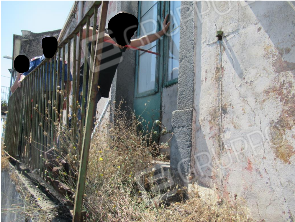
Foto n° 1 – Apertura dell'immobile ad opera del fabbro in presenza dei Carabinieri –