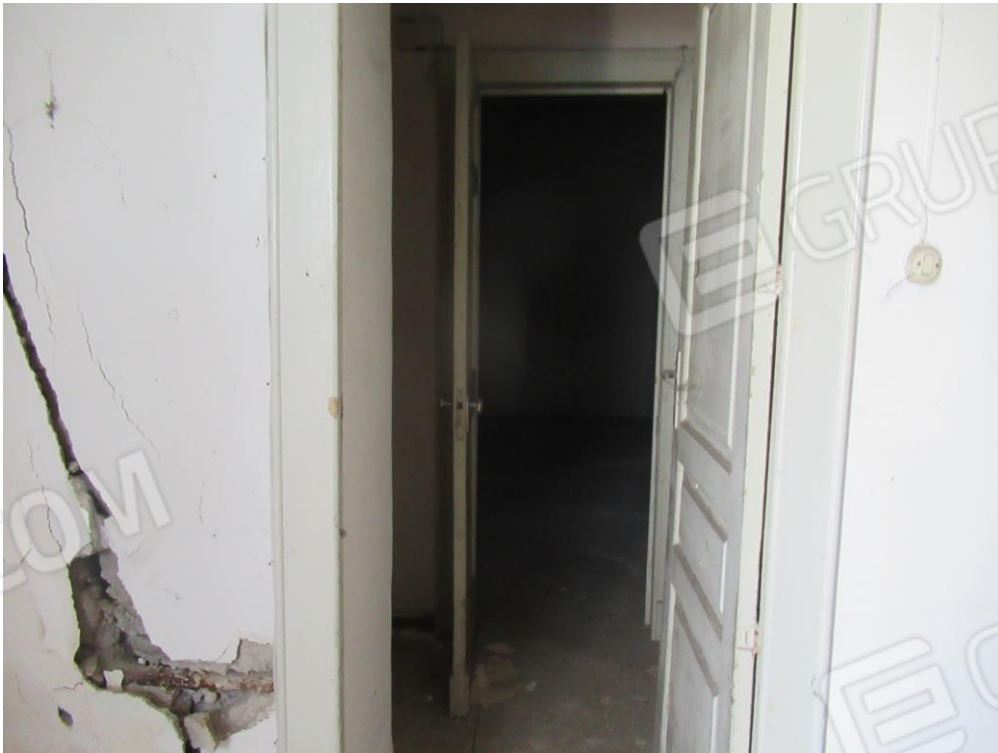
Foto n ° 10 – Condizioni dell'immobile riscontrate al sopralluogo –