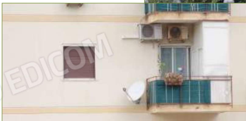
Prospetto posteriore dell'u.i. oggetto di pignoramento.