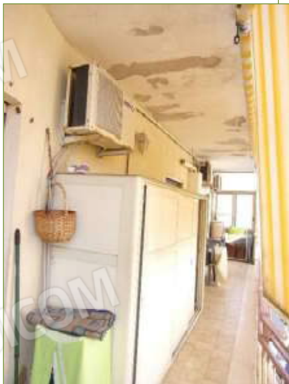
Balcone sul prospetto principale dell'u.i. oggetto di pignoramento.