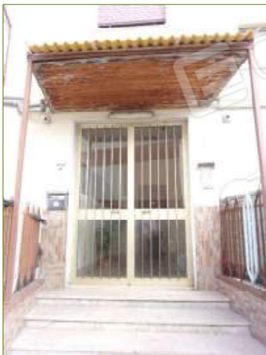
Accesso all'u.i. oggetto di pignoramento su Via Antonio De Curtis n.1 (già (già via Maria Grazia Costanzo n.25) 90040 Capaci (PA)