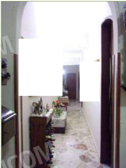
Interni Ingresso e corridoio