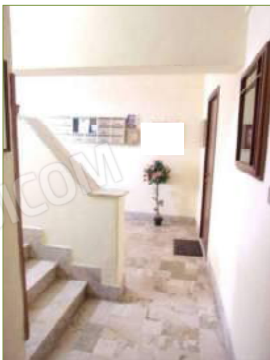
Androne scala dell'u.i. oggetto di pignoramento su Via Antonio De Curtis n.1 (già via Maria Grazia Costanzo n.25) 90040 Capaci (PA)