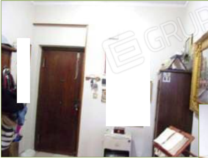
Interni Ingresso e corridoio

G.E.: dott.ssa M.C. LA BARBERA / CTU: arch. Vincenzo BARRA