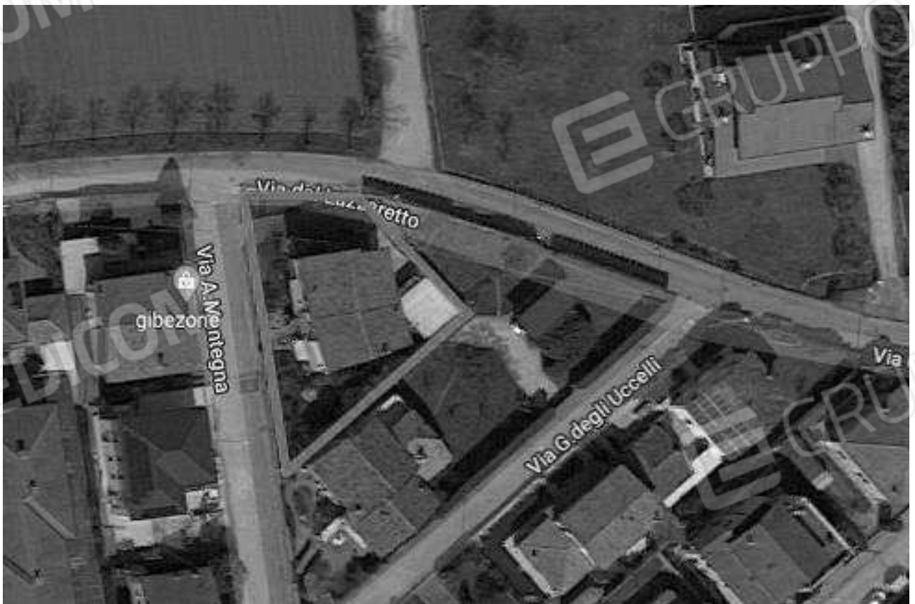
Immagine 2 | Individuazione dell'edificio