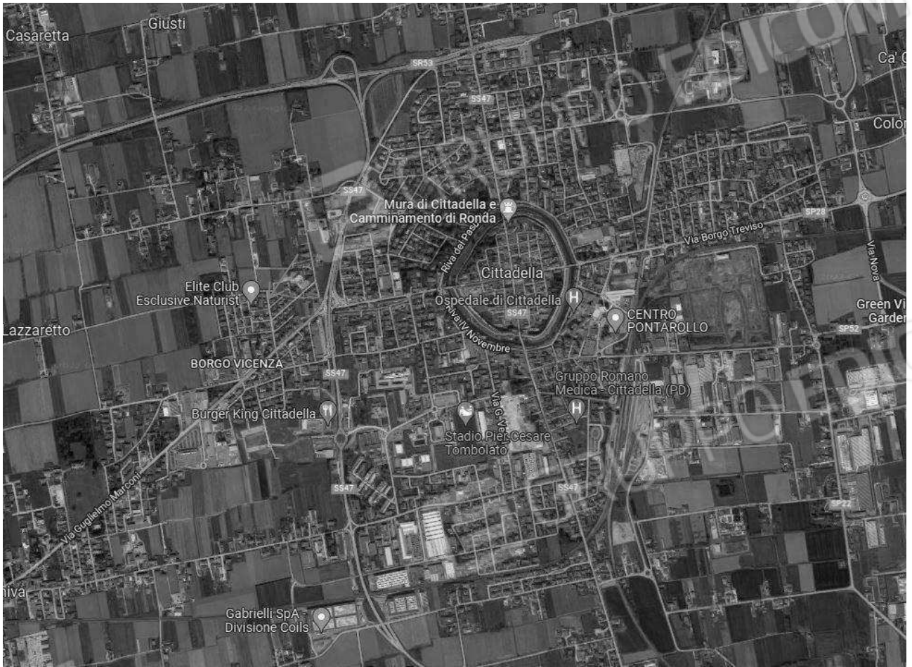
Immagine 1 | Vista aerea di Cittadella