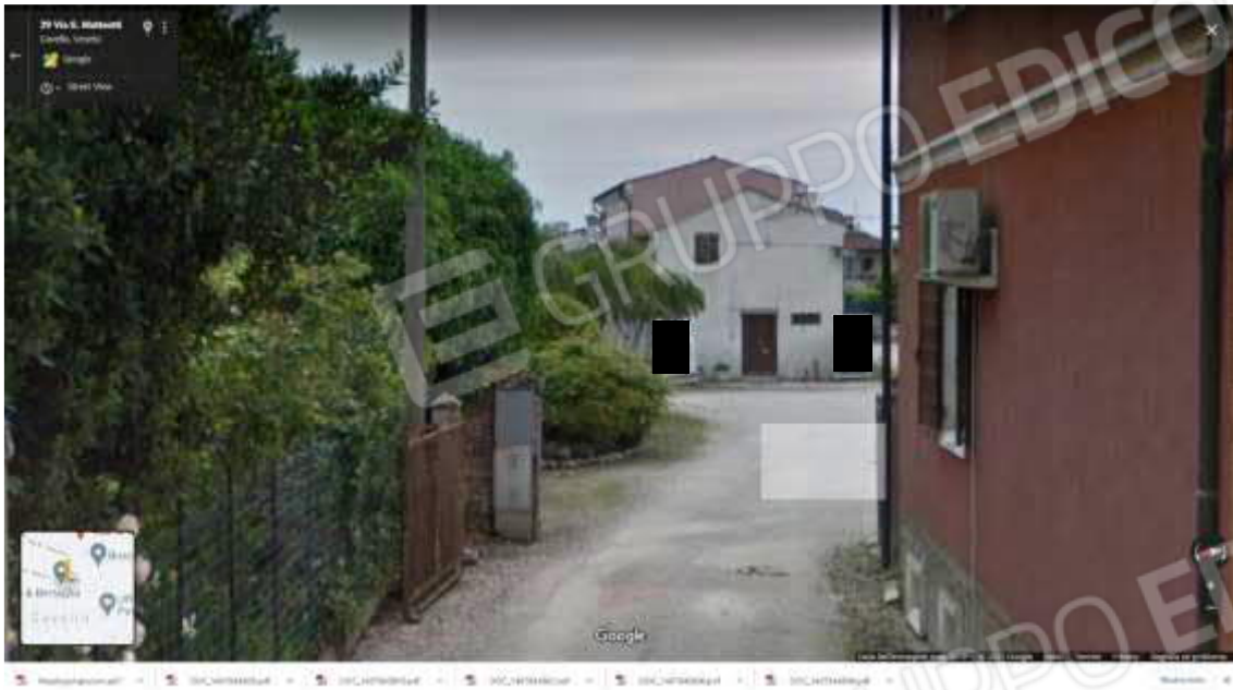
Figura 6 esterno lato Ovest veduta da Via Marconi