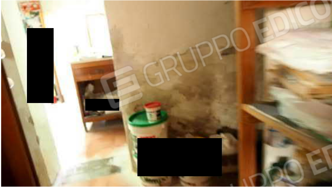
Figura 8 Interni piano terra risalita umidità alla base murature porzione Ovest vecchia costruzione