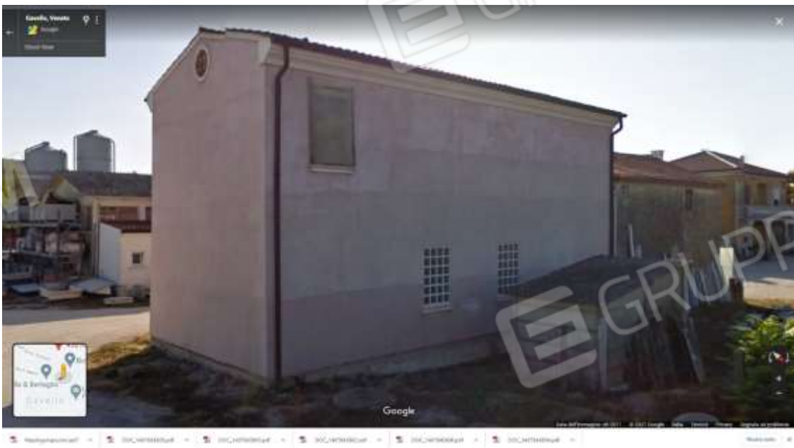
Figura 5 esterno lati Nord-Est