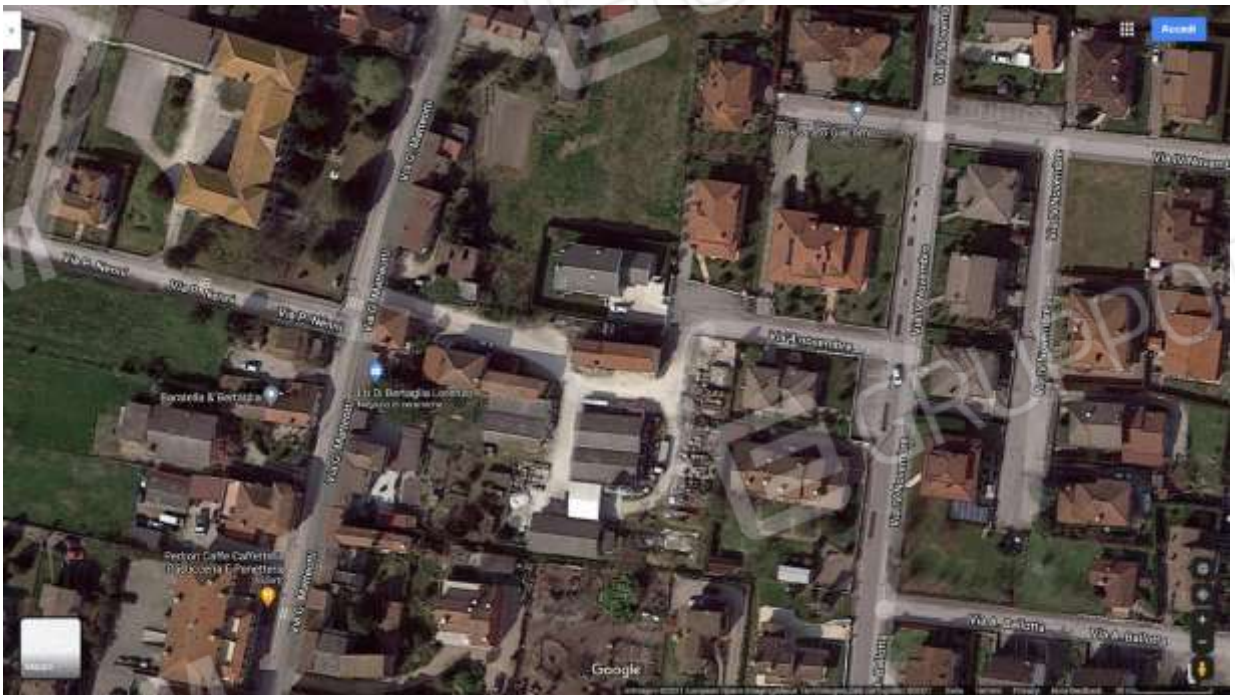
Figura 1 veduta aerea