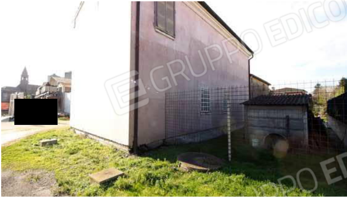
Figura 4 esterno lati Nord-Est