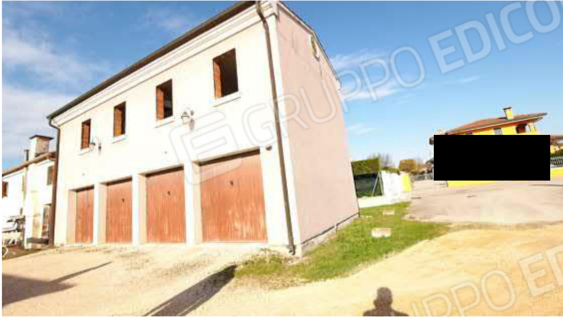
Figura 2 Esterno Sud-est