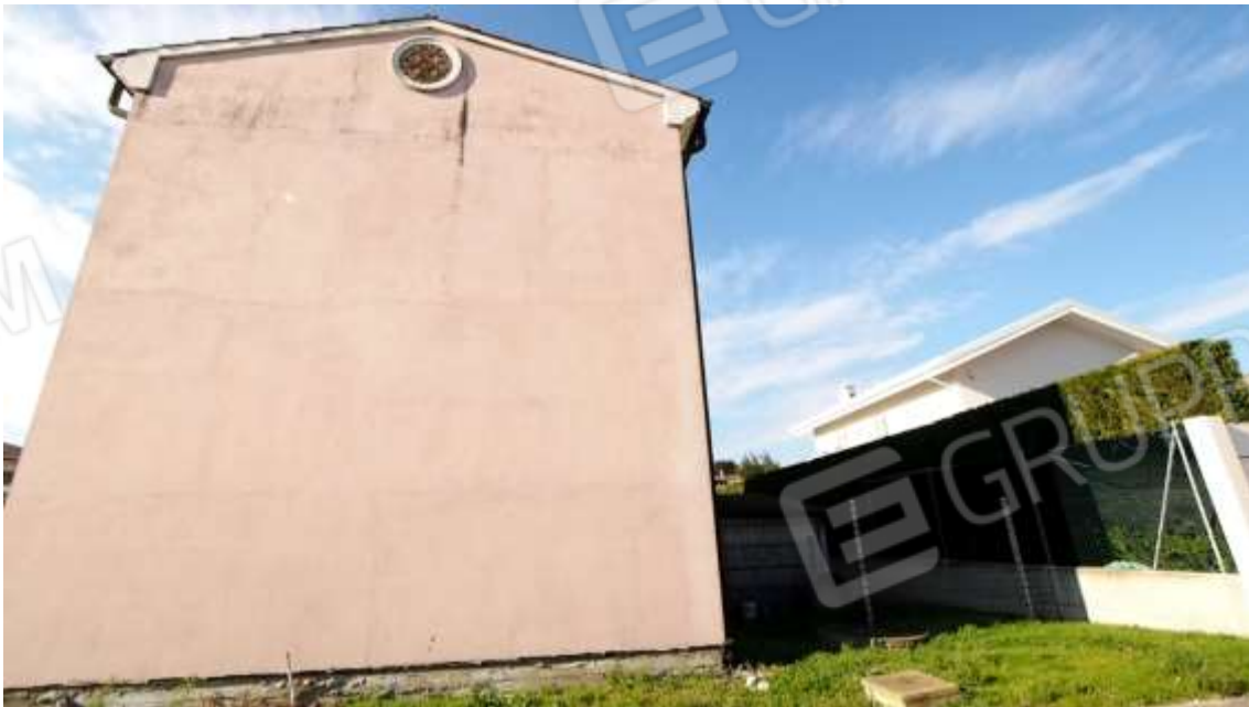
Figura 3 esterno lato Est