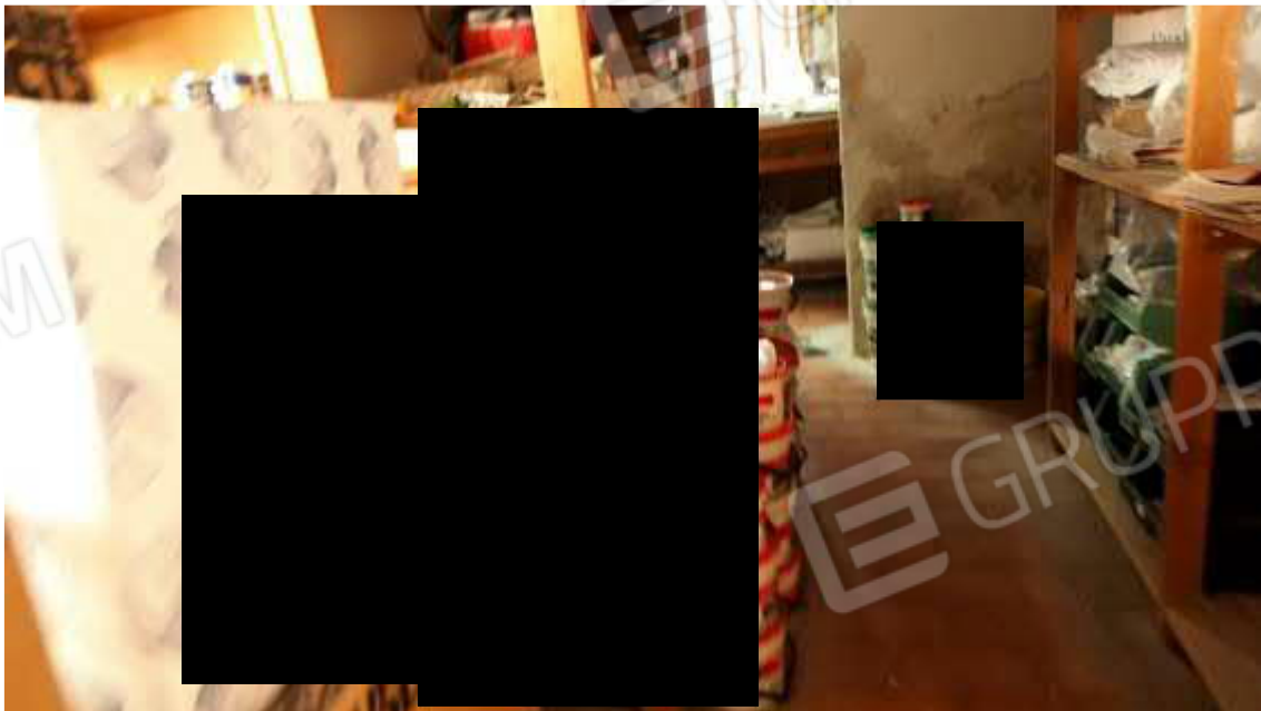
Figura 7 Interni piano terra porzione Ovest vecchia costruzione