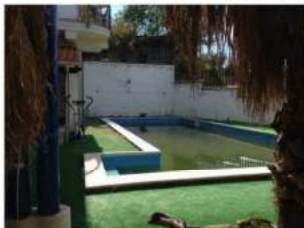
Foto ritraente la piscina