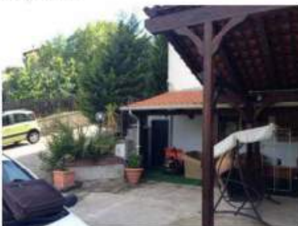
Foto ritraente parte della tettoia al piano semint.