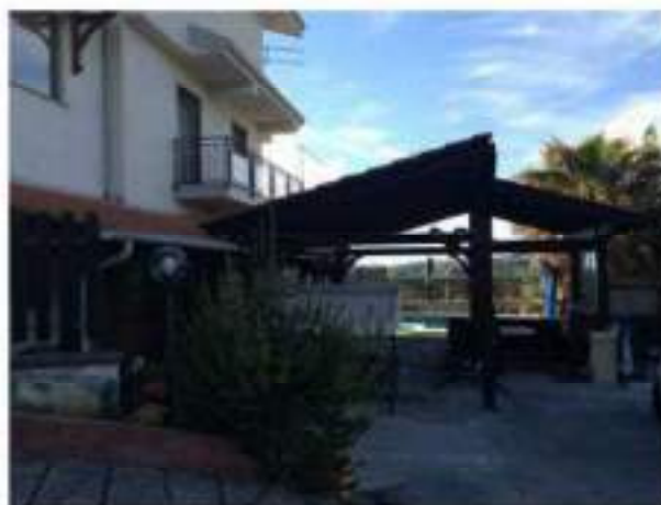
Foto ritraenti parte della tettoia al piano semint.