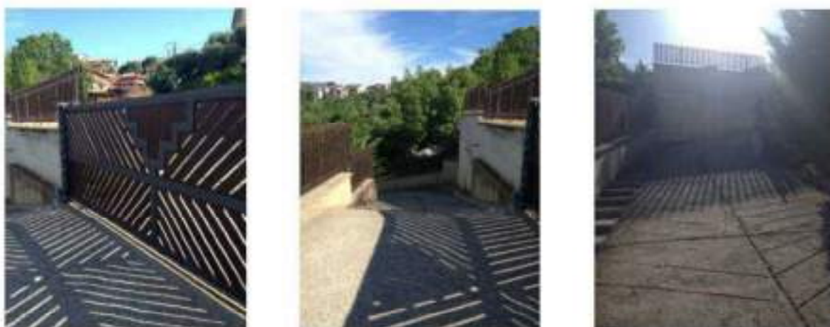
Foto ritratti il cancello d'ingresso e rispettiva rampa d'accesso

b1) Piano seminterrato. Con ingresso principale dal portone antistante la tettoia in legno posta al medesimo livello, lato Est, internamente è suddiviso da un ampio locale adibito a tavernetta, una cucina, un servizio igienico, una lavanderia, ed un piccolo ripostiglio sotto scala. Il collegamento interno con il soprastante piano terra è garantito dalla scala in c.a. a doppia rampa. I tre lati interrati, confinano con l'intercapedine generata tra la struttura dell'intero piano ed muri di L'altezza netta prevalente del precitato piano seminterrato è pari a mt 3,10, con una superficie netta calpestabile pari a mq 105,73.