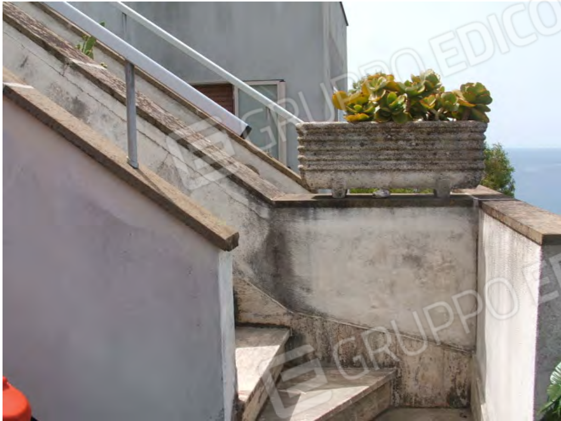
Superfici delle scale e dei parapetti con presenza di muffe e distacchi