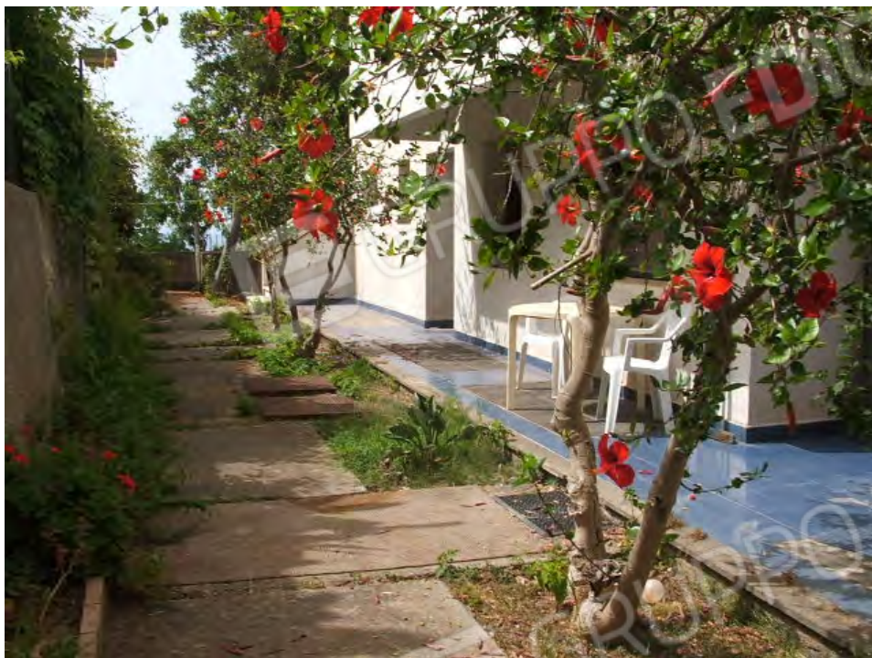
Piano terra unità collabenti