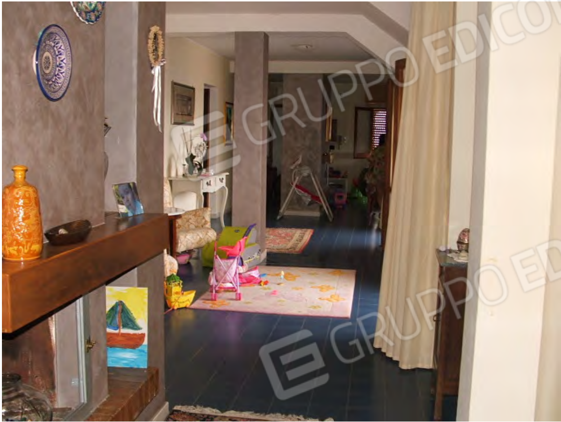
Piano 1° abitabile