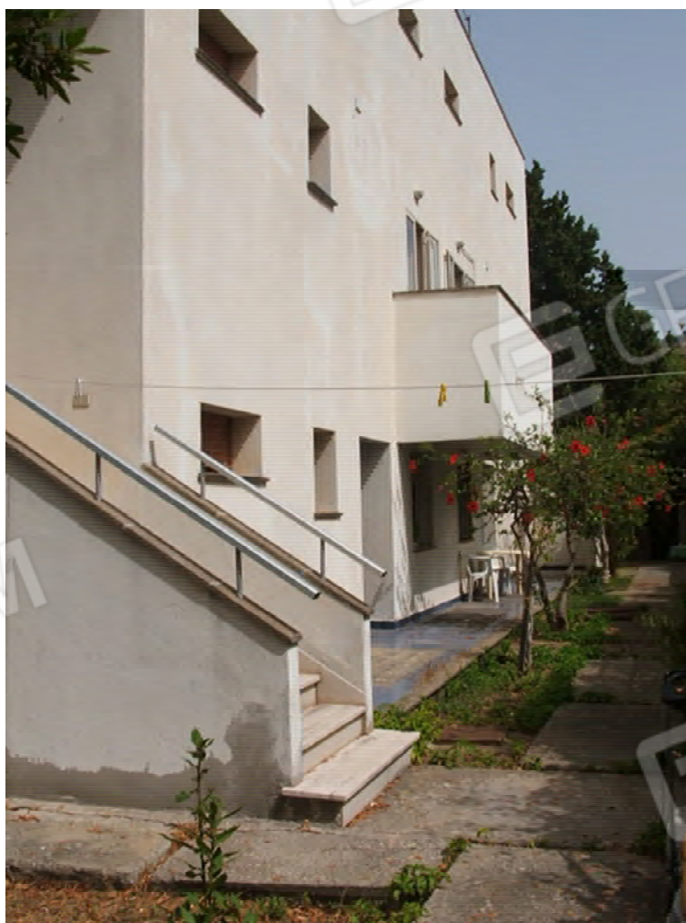
Scala che dal piano terra (unità collabenti) porta al primo piano abitabile