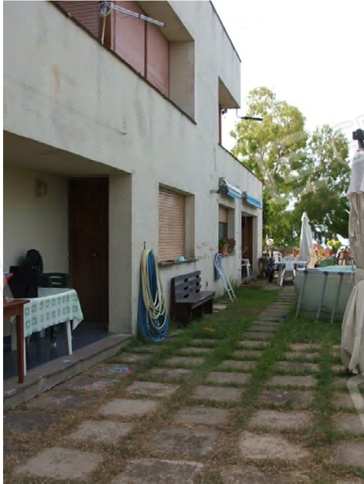
Piano seminterrato unità collabenti