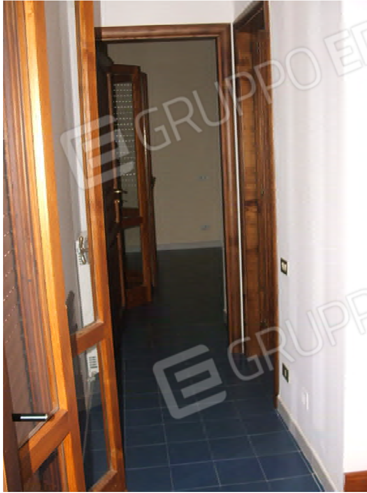
Piano secondo abitabile