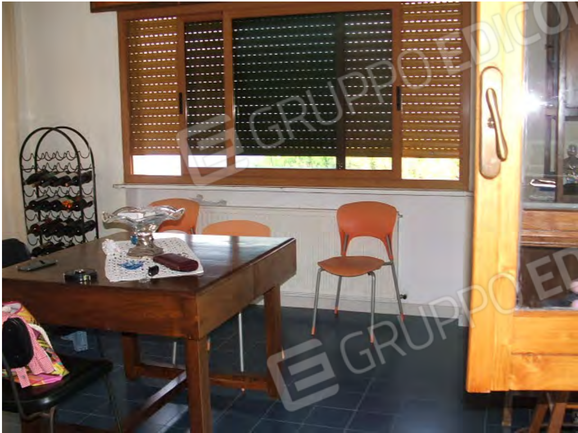
Piano 1° abitabile