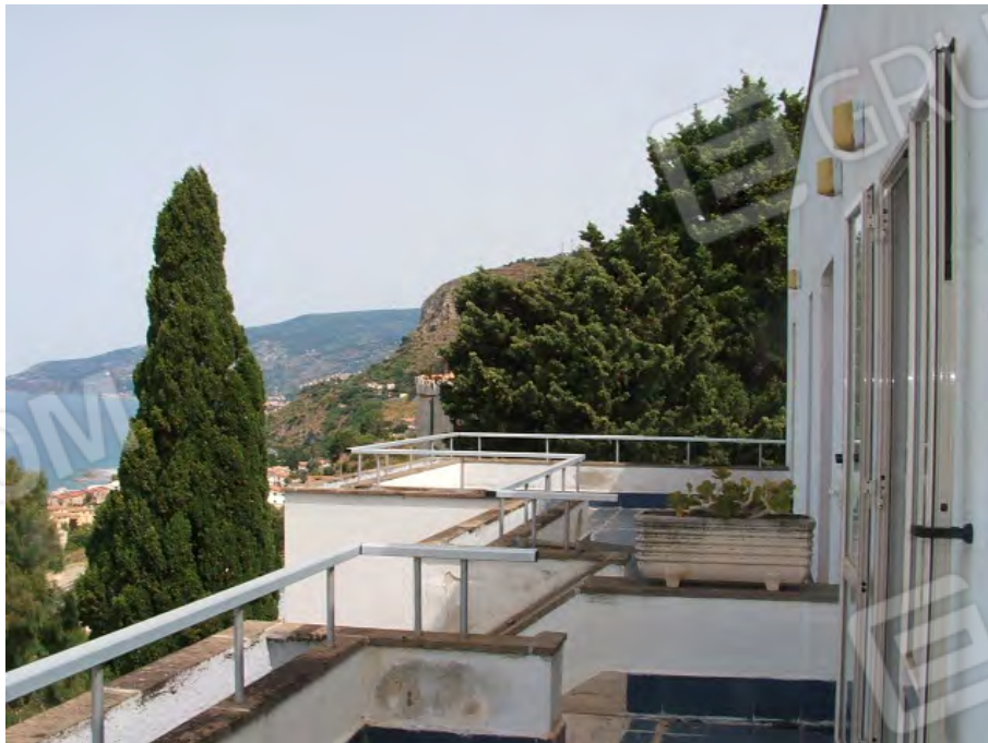
Vista verso nord-ovest