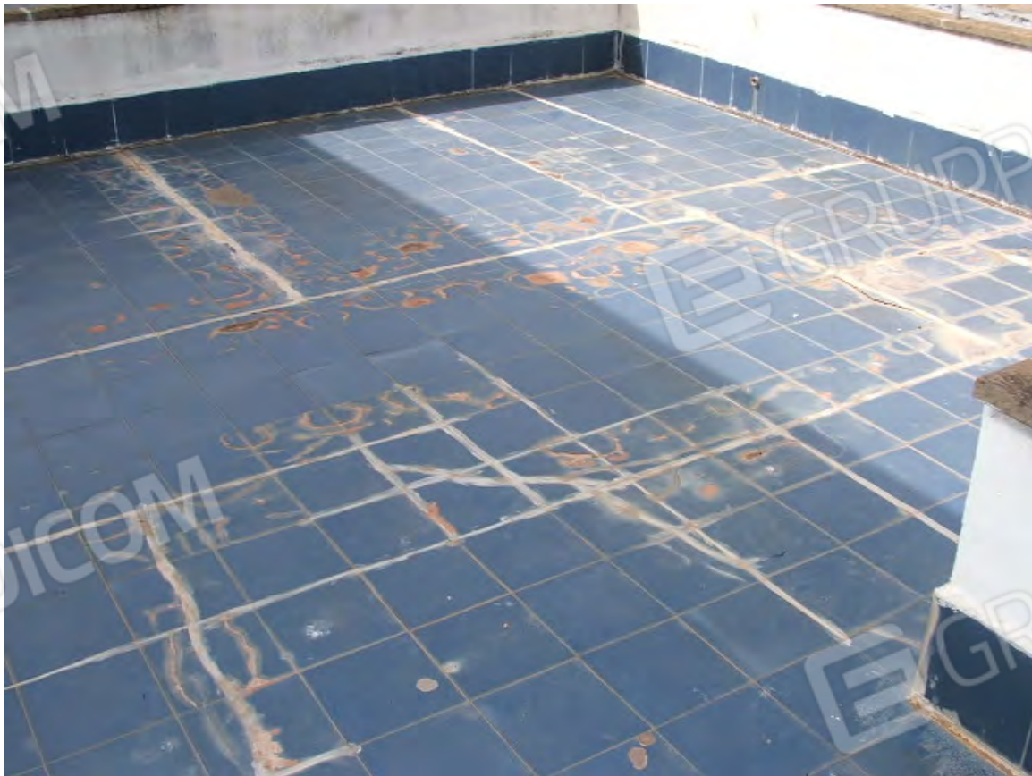
Pavimentazioni terrazzi con fenomeni di degradato