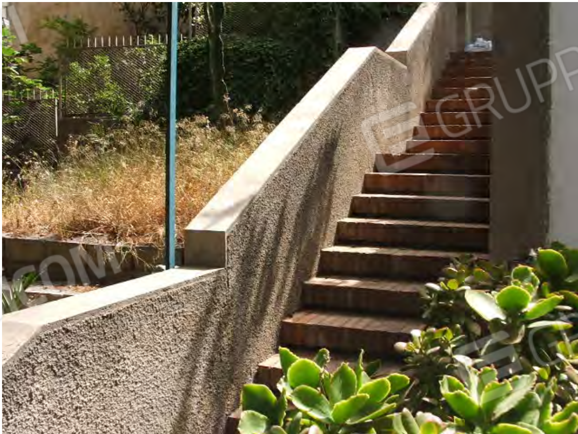
Scalinata verso il piano terra unità collabenti