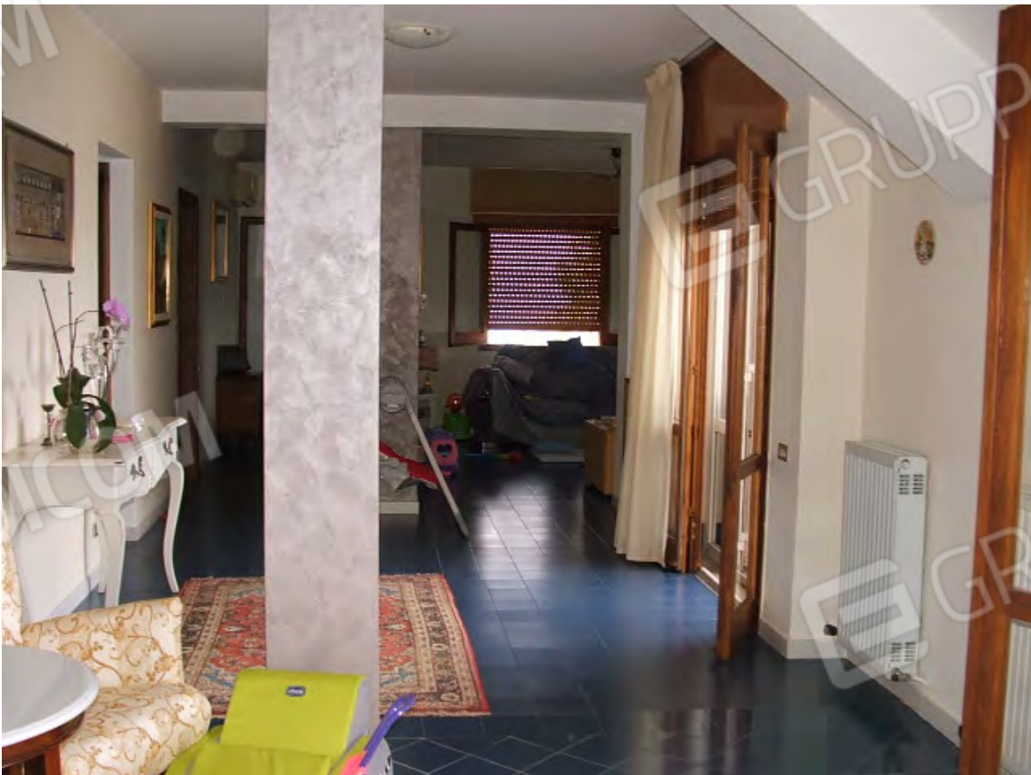
Piano 1° abitabile