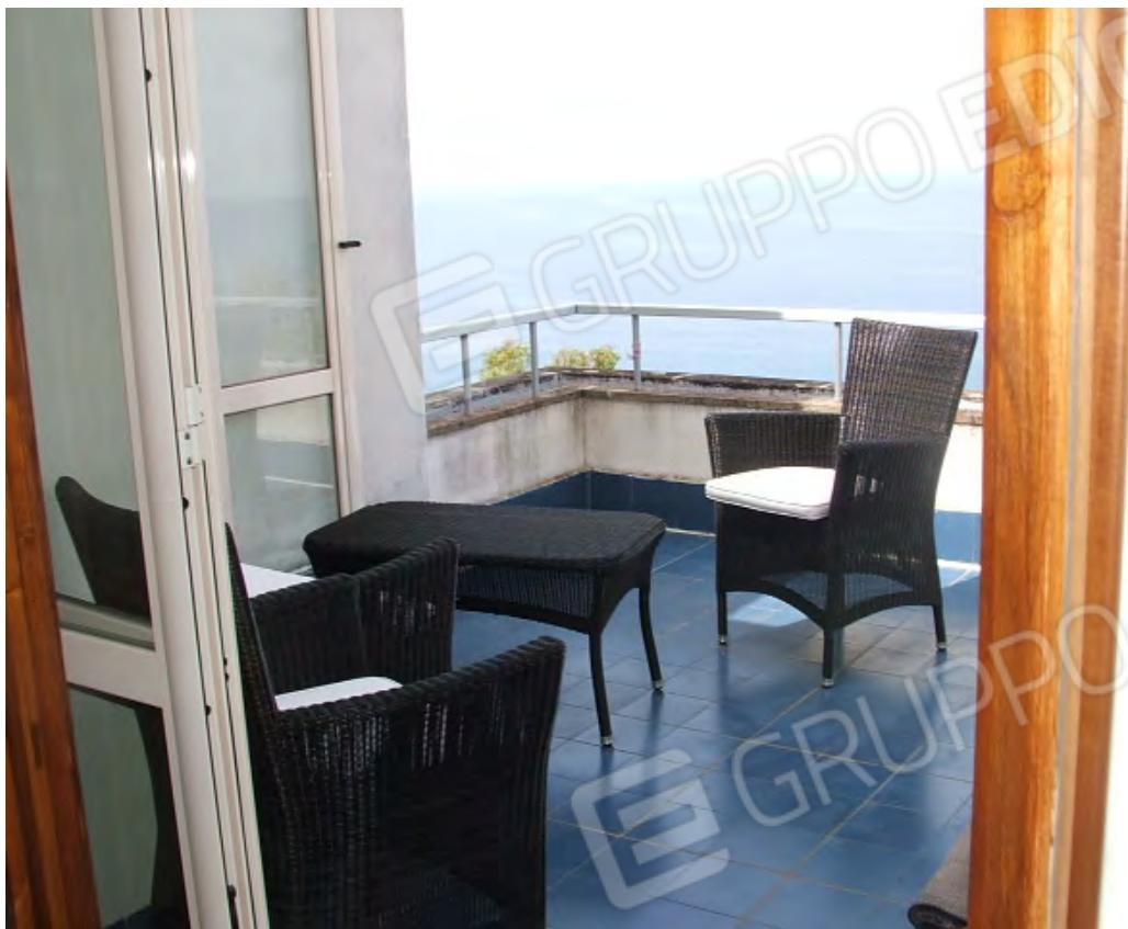
Terrazzino lato ovest