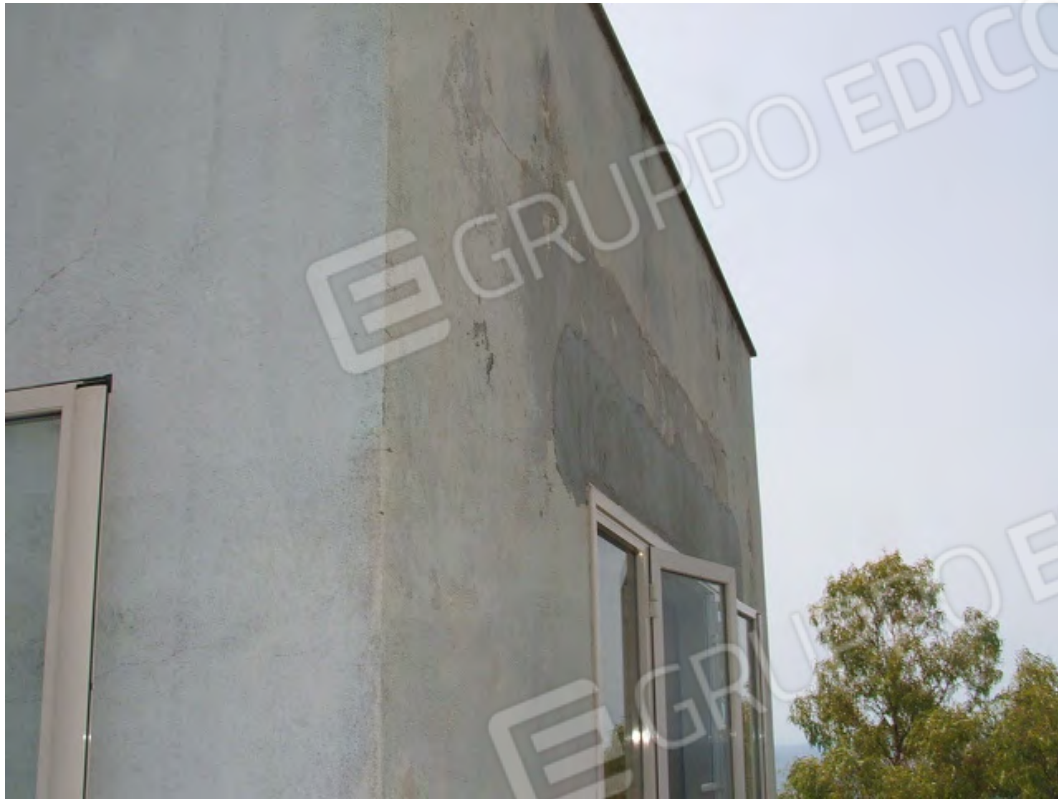
Superfici prospettiche degradate