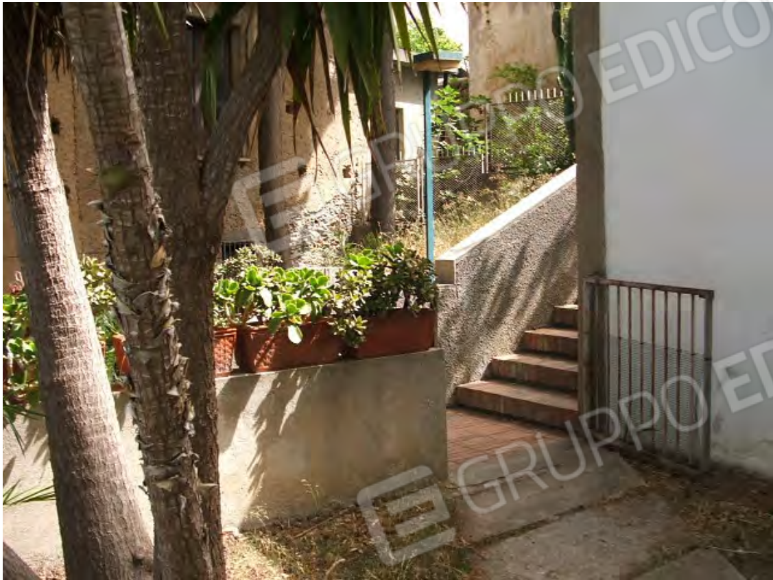
Scalinata verso il piano terra unità collabenti