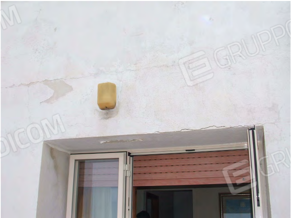
Superfici prospettiche degradate