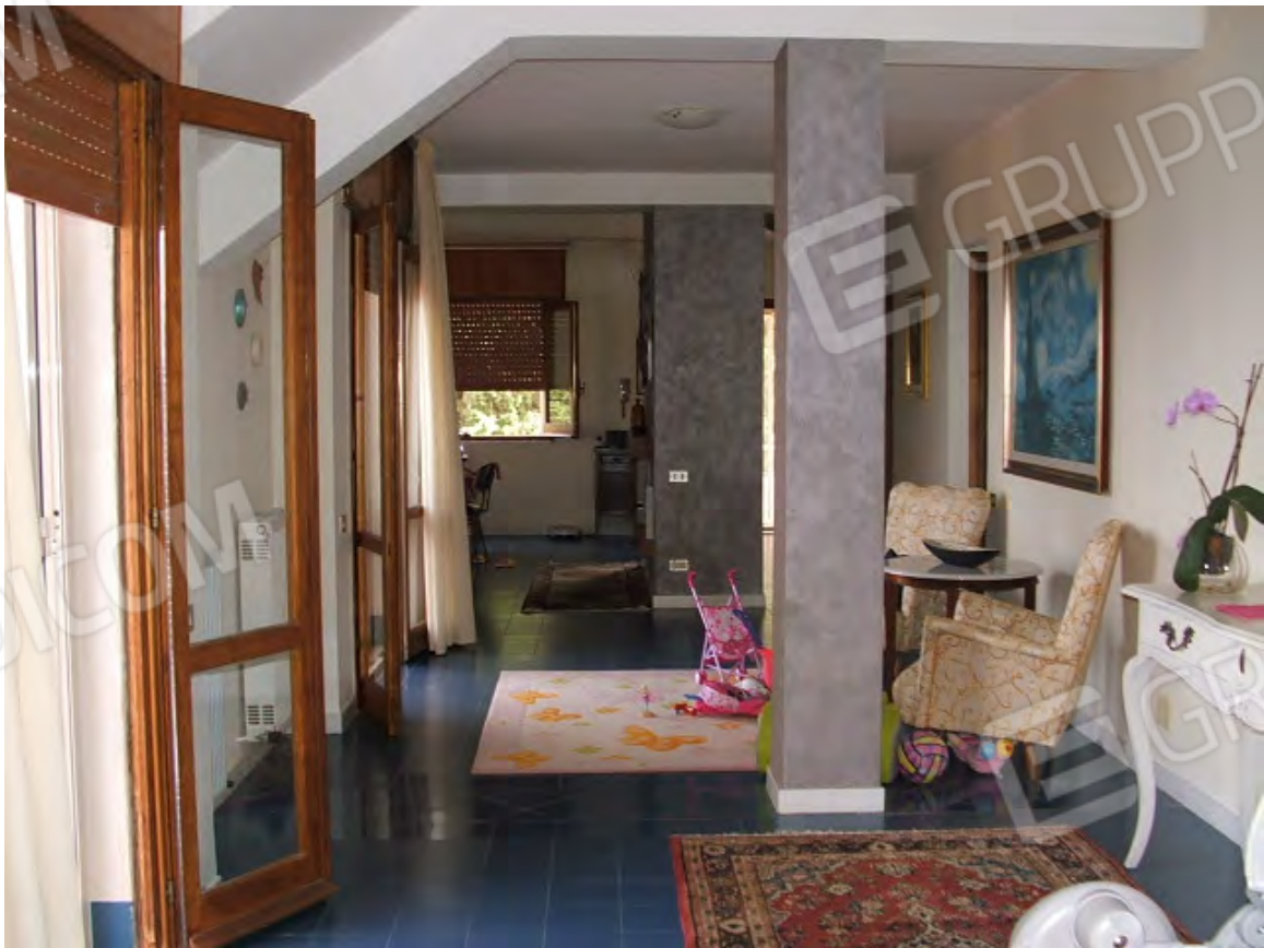
Piano 1° abitabili