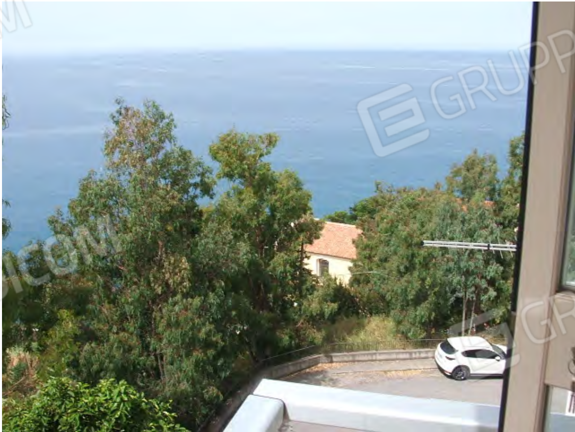
Vista dal terrazzo verso ovest