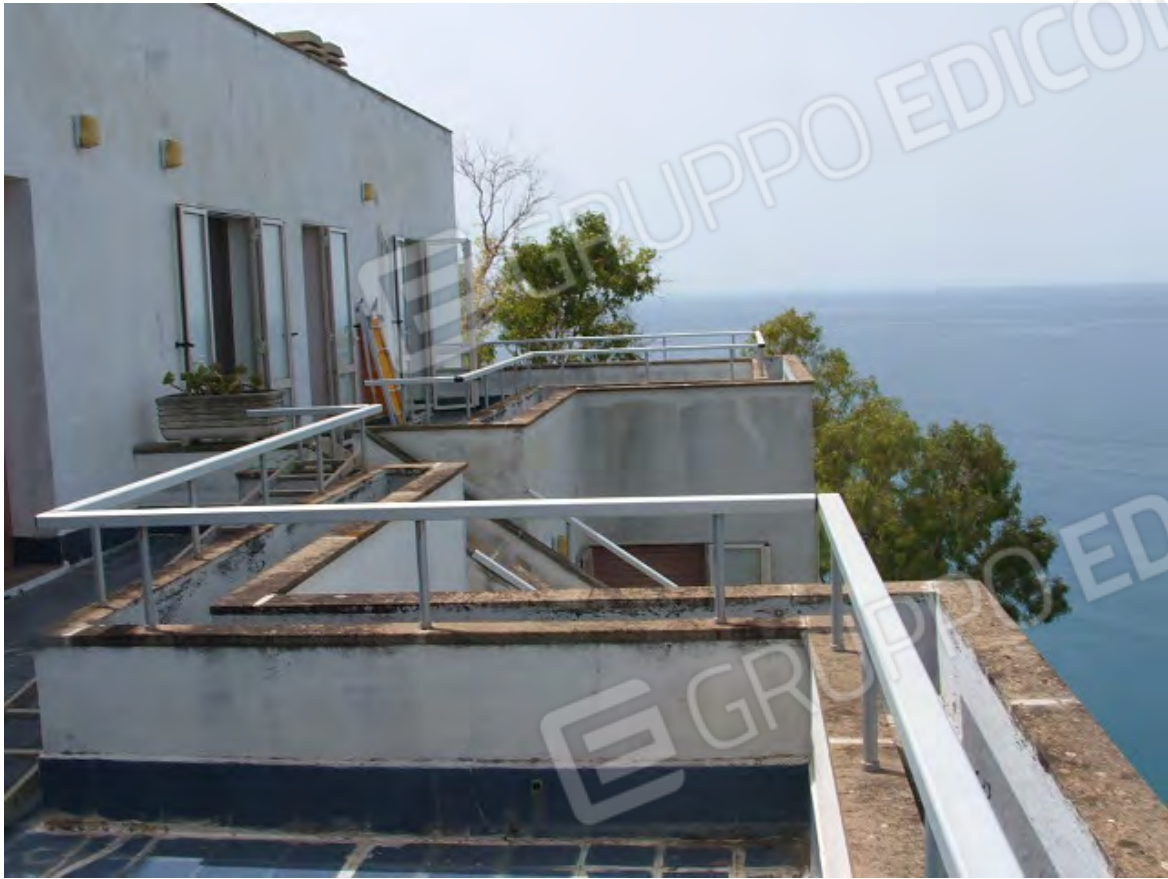
Terrazzi verso ovest