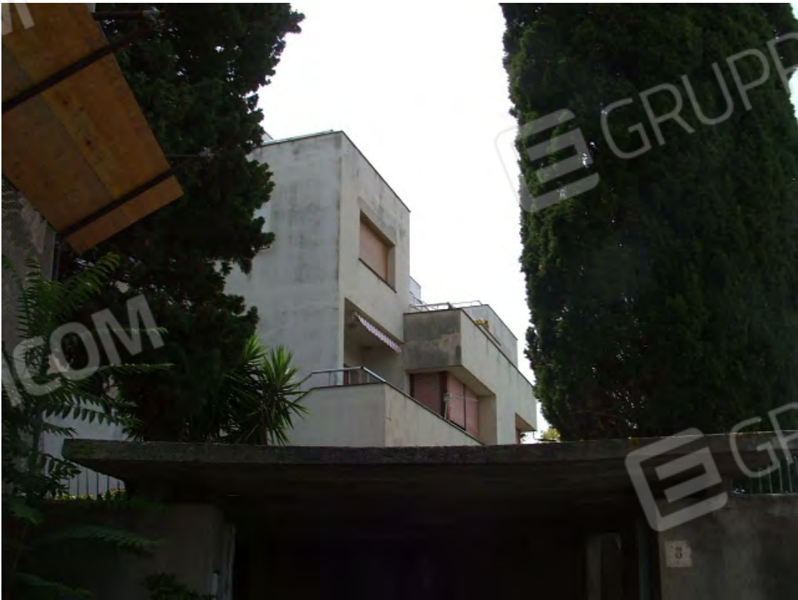
Vista dalla strada di accesso.