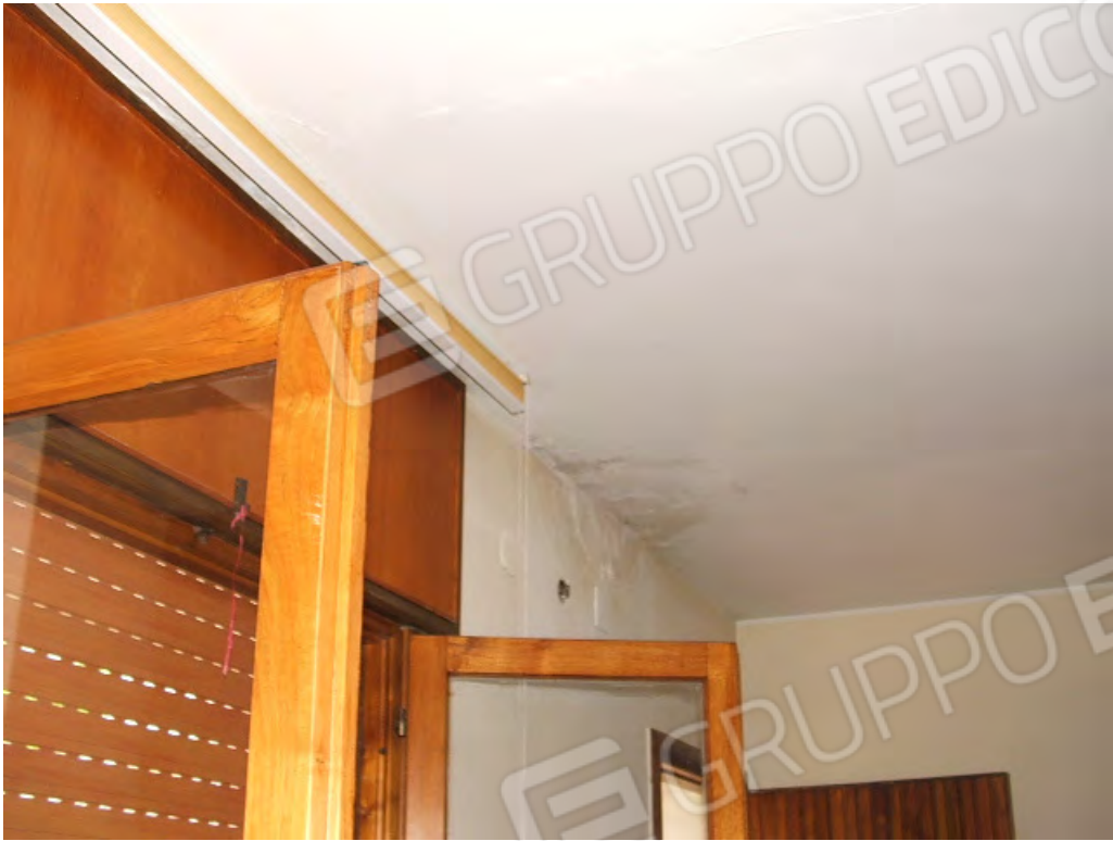
Infiltrazione acqua piovana dalla copertura