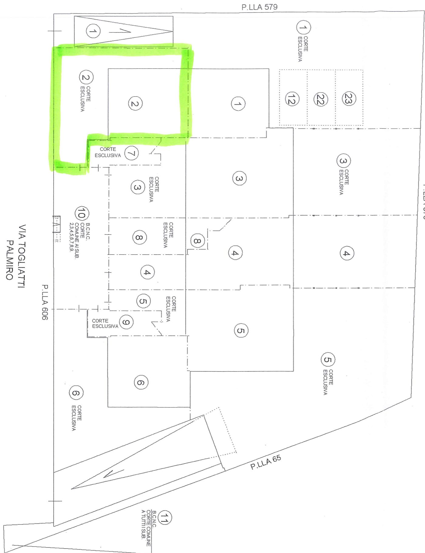
PIANO TERRA H = 2.70