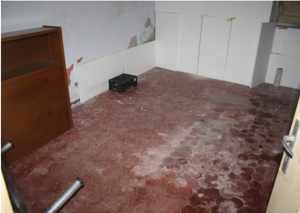
vista interna piano primo