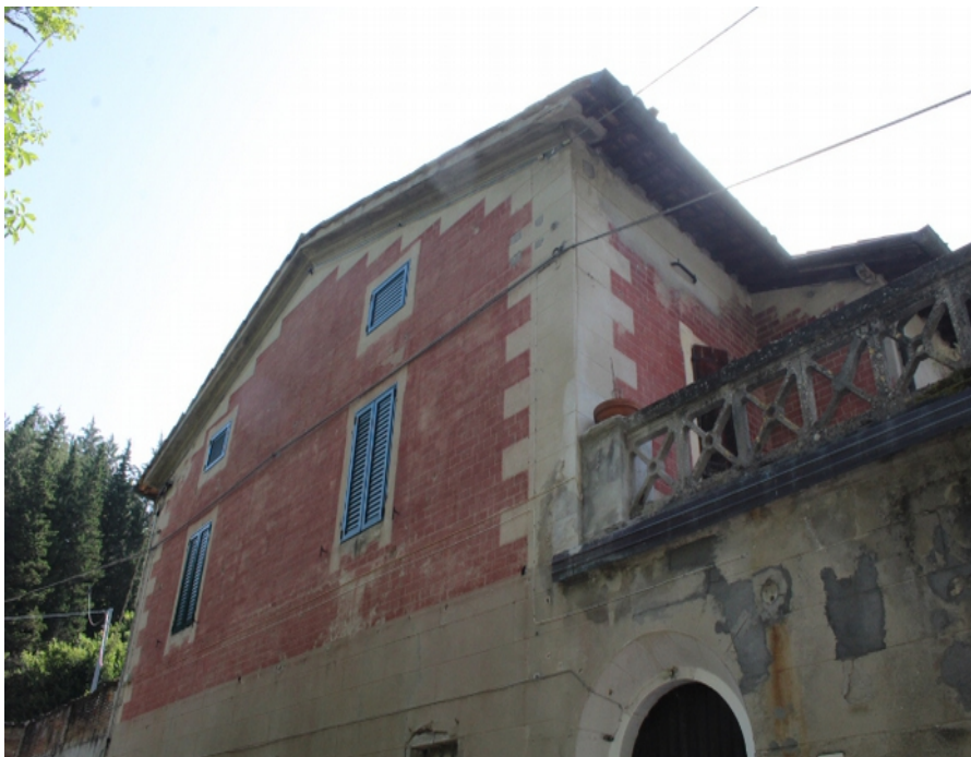
Vista del fabbricato dalla corte

E' stato eseguito anche un dettagliato rilievo fotografico degli esterni ed interni, che con relativa didascalia si allega (v. doc. 2F). Alcune foto, più significative, dell'esterno e dell'interno, si includono di seguito