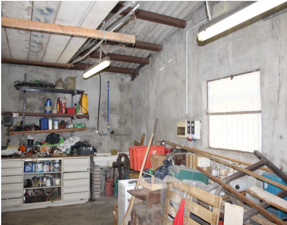
deposito-cantina a fianco al garage