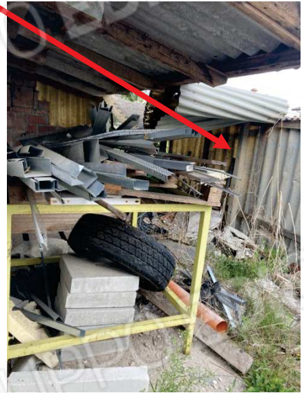
prospetto lato Sud del deposito esistente compresa la porzione di fabbricato abusivo da demolire e tetto in eternit da rimuovere e smaltire