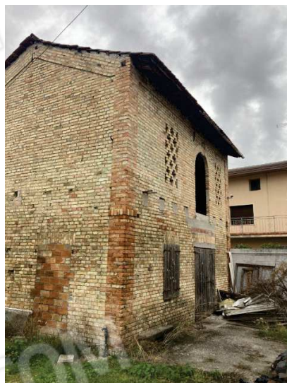
prospetto lato Sud