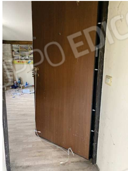
viste ingresso deposito al primo piano