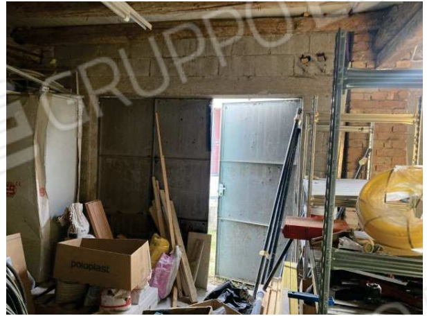
viste interne del deposito al piano terra