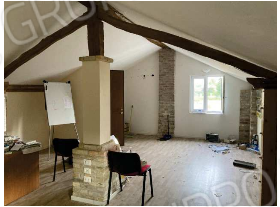
viste interne locale deposito ristrutturato per il "ricavo di un ufficio" privo di requisiti di agibilità