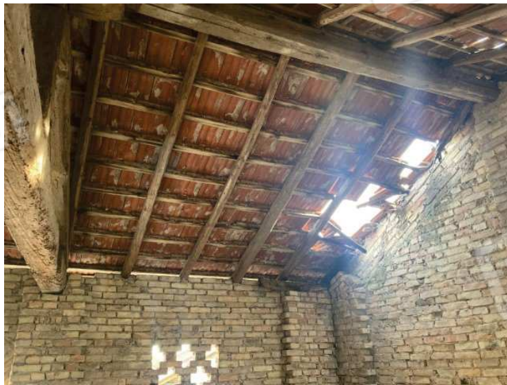
particolare parte di tetto crollato nel deposito al primo piano