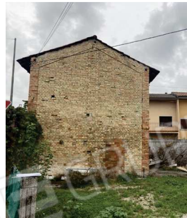
prospetto lato Ovest