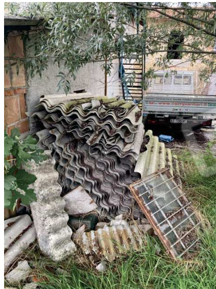
particolare eternit a terra da smaltire