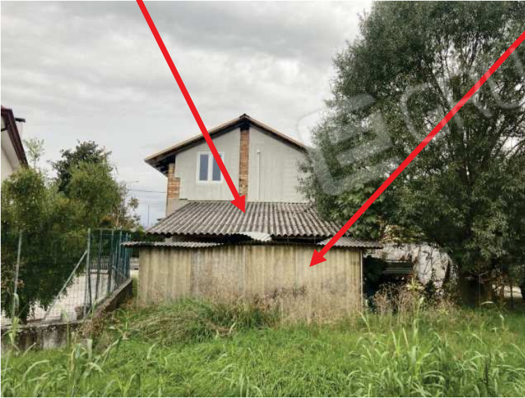
porzione di fabbricato abusivo da demolire e smaltire