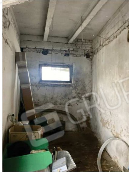
viste interne depositi al piano terra