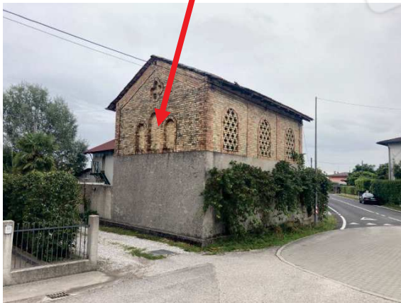
prospetto lato Nord-Est locali di deposito “quali accessori d’abitazione” sito in prossimità di Via Policreta

fabbricato oggetto di esecuzione immobiliare