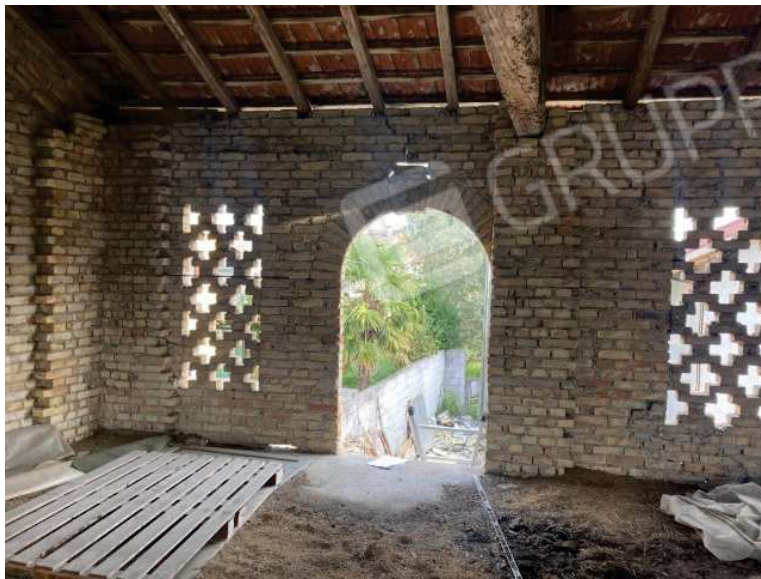
viste interne deposito al primo piano