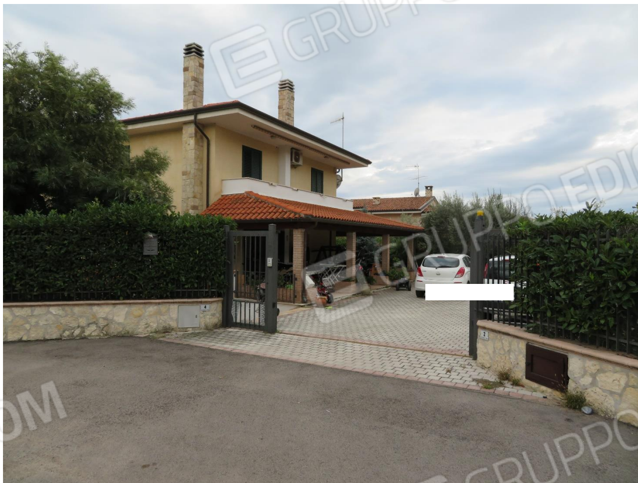
VISTA DELL'INGRESSO ALL'AREA ESTERNA E AL FABBRICATO DALLA STRADA COMUNALE