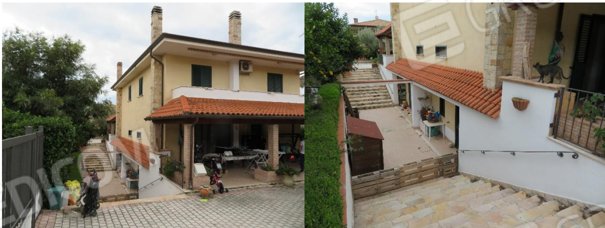
VISTE DELL'AREA ESTERNA E DELL'ACCESSO AL PIANO SEMINTERRATO