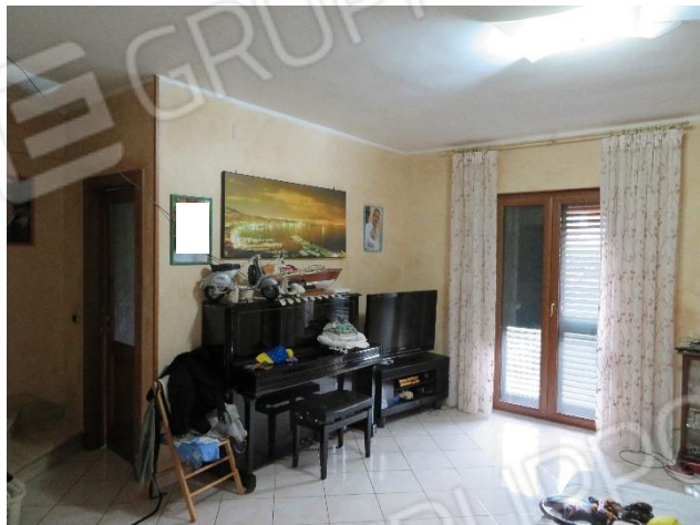
VISTE DELL'INTERNO DEL PIANO TERRA: CUCINA E SOGGIORNO