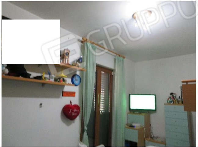
VISTE INTERNE DI DUE DELLE CAMERE AL PRIMO PIANO