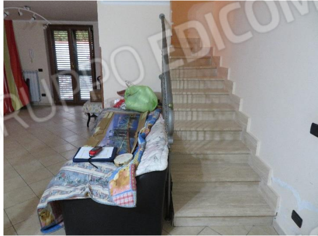
VISTE DELL'INTERNO DEL PIANO SEMINTERRATO E DELLA SCALA INTERNA DI ACCESSO ALLO STESSO