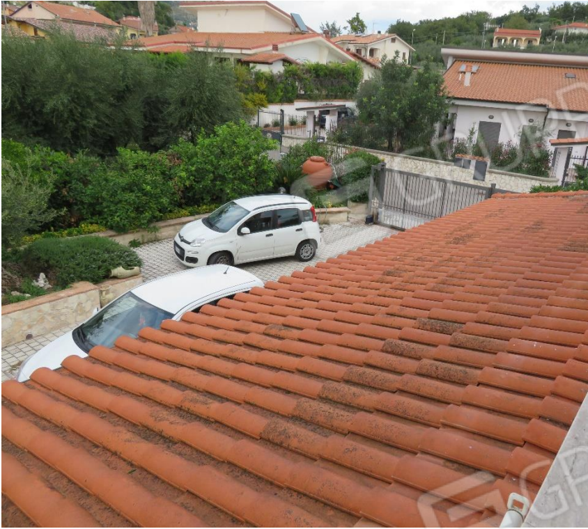
VISTA DEI POSTI AUTO ESTERNI DAL BALCONE DEL PIANO PRIMO