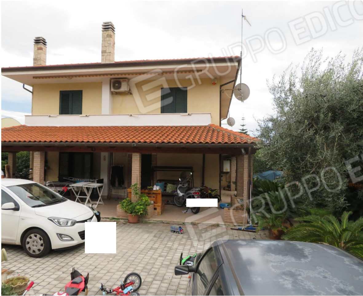
VISTA DELL'INGRESSO ALL'AREA ESTERNA E DEL PROSPETTO PRINCIPALE CON PORTA DI INGRESSO SOTTO IL PORTICO