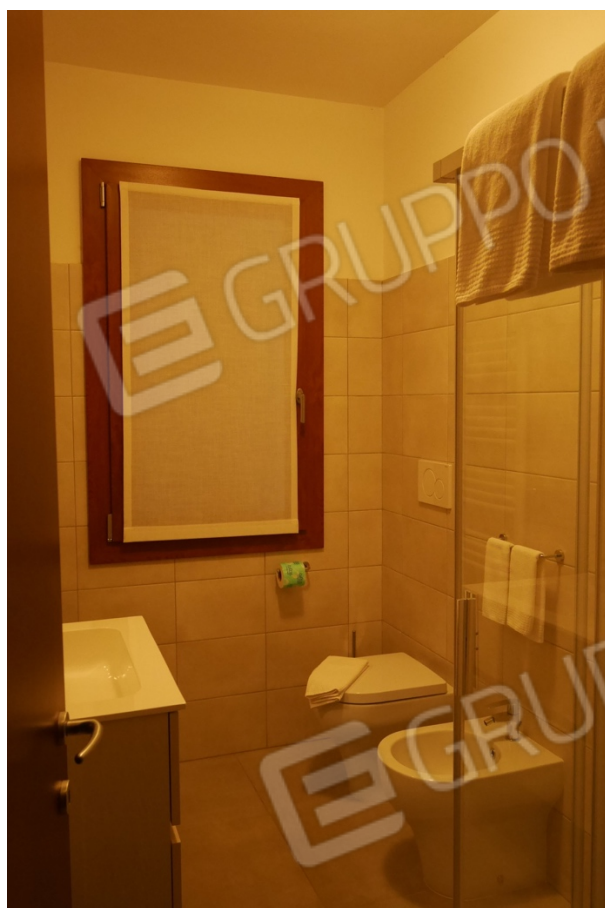
FOTO 9 - Edificio ad uso albergo. Piano primo. Uno dei bagni presenti nelle camere.